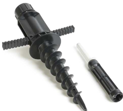
Świder plastikowy do wwiercania w grunt