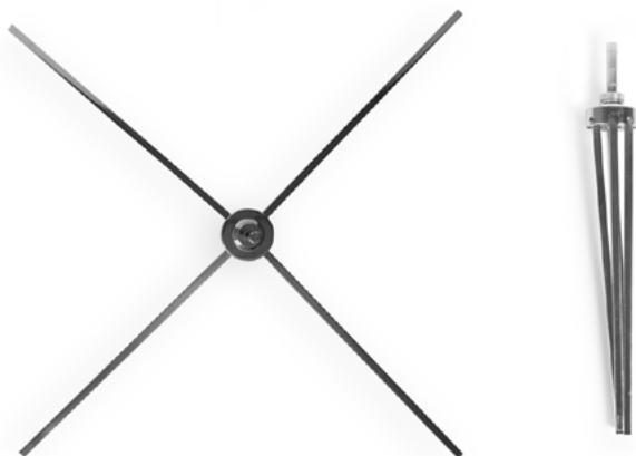
Podstawa krzyżakowa obrotowa z chromowanej stali